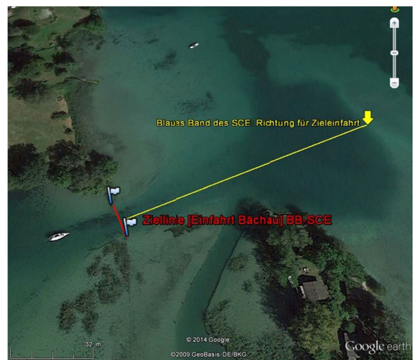
Abbildung b): fiktive Ziellinie Einfahrt Bächau